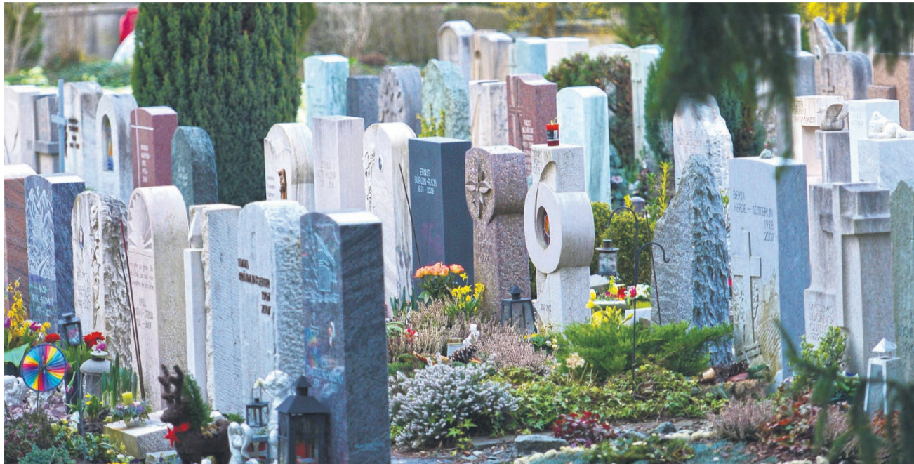
Das Erbrecht ermöglicht, mit einem Testament oder einem Erbvertrag den Nachlass individuell zu regeln.

Wenn jemand keine Verfügung von Todes wegen (Testament oder Erbvertrag) errichtet hat, tritt bei seinem Ableben die gesetzliche Erbfolge ein. D. h., das Erbrecht, das im Schweizerischen Zivilgesetzbuch geregelt ist, bestimmt die gesetzlichen Erben und regelt die Reihenfolge, in der diese zum Zuge kommen. Das Gesetz bestimmt auch, wie viel jeder Erbe bekommt.