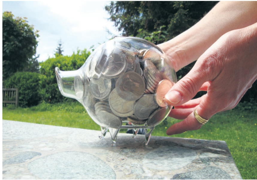
Die Aufteilung des angesparten Vermögens ist bei mancher Erbteilung mit Streitigkeiten verbunden ...

Mit unserem Ableben lassen wir nicht nur lieb gewonnene Menschen zurück, sondern auch unsere Vermögenswerte und Werke. Vermögenswerte, die einem ganz bestimmten Zweck dienen oder ganz bestimmten Personen zugute kommen sollen. Ohne Ihre anderweitige Verfügung fällt Ihr Nachlass Ihren gesetzlichen Erben nach bestimmten Quoten zu. Bis zur Feststellung der Erben, die durch das Präsidium des Bezirksgerichts mit einer Erbbescheinigung erfolgt, ist Ihr Nachlass blockiert und die Erben können nicht darüber verfügen. Die Erbbescheinigung wird zufolge gesetzlicher Fristen in der Regel erst drei Monate nach dem Tod des Erblassers ausgestellt. Daher tun besonders Ehegatten gut daran, immer