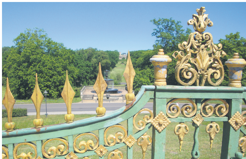
Nutzniessung oder Wohnrecht? – Es muss ja nicht gerade an einem Palast sein...

Die Nutzniessung ist in Art. 745 ff. ZGB geregelt. Sie ist das Recht, gewisse Sachen zu nutzen und zu gebrauchen. Der Nutzniesser kann die Liegenschaft selber bewohnen oder auch vermieten. Die Mietzinseinnahmen gehören dem Nutzniesser. Konsequenterweise muss der Nutzniesser den Eigenmietwert respektive die eingenommenen Mietzinse als Einkommen versteuern. Der Nutzniesser ist nicht Eigentümer der Liegenschaft, er hat kein Verfügungsrecht. Das heisst, dass er das Haus weder verkaufen noch verschenken noch umbauen noch mit Hypotheken belasten kann. Dazu ist einzig der Eigentümer berechtigt. Möchten die Eltern als Nutzniesser beispielsweise bauliche Veränderungen vornehmen, haben sie die Nachkommen als Eigentümer der Liegenschaft zu fragen. Die Nutzniessung kann nicht nur