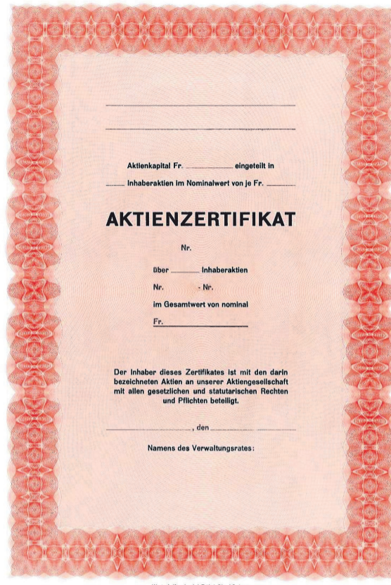
Inhaberaktien ab 1. Mai 2021 fast nur noch bei börsenkotierten Unternehmen.

Zukünftig sind Inhaberaktien nur noch zulässig, wenn die Gesellschaft Beteiligungspapiere an einer Börse kotiert oder die Inhaberaktien als Bucheffekten ausgestaltet hat. Alle anderen Inhaberaktien müssen innerhalb von 18 Monaten nach Inkrafttreten dieser Gesetzesänderung – das heisst bis am 30. April 2021 – in Namenaktien umgewandelt werden. Für die Umwandlung sind die Gesellschaftsstatuten anzupassen.