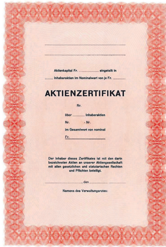
Inhaberaktien ab 1. Mai 2021 fast nur noch bei börsenkotierten Unternehmen.

Zukünftig sind Inhaberaktien nur noch zulässig, wenn die Gesellschaft Beteiligungspapiere an einer Börse kotiert oder die Inhaberaktien als Bucheffekten ausgestaltet hat. Alle anderen Inhaberaktien müssen innerhalb von 18 Monaten nach Inkrafttreten dieser Gesetzesänderung – das heisst bis am 30. April 2021 – in Namenaktien umgewandelt werden. Für die Umwandlung sind die Gesellschaftsstatuten anzupassen.