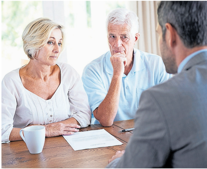
Die Vertretung bei Urteilsunfähigkeit mit dem Vorsorgeauftrag und der Patientenverfügung regeln.

Der Vorsorgeauftrag und die Patientenverfügung sind Mittel, um selbst zu bestimmen, wer nach dem Verlust der Handlungsfähigkeit die notwendigen Entscheidungen treffen soll.