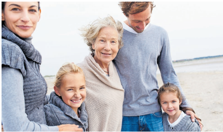
Neues Erbrecht ab 2023

– Den Eltern stand bisher, sofern keine Nachkommen vorhanden sind, ein